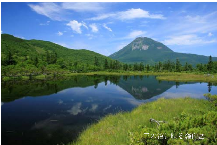
「三の沼に映る羅臼岳」

標高600～700mの羅臼湖周辺は、本州中部の2000～2500mに相当する環境です。それぞれ表情の異なる大小5つの沼に立ち寄り、高山植物や湿地の植物との出会いを楽しみながら羅臼湖を目指します。多様な環境が存在する知床の豊かさを感じることができます。