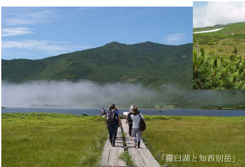
「羅臼湖と知西別岳」