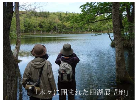
「木々に囲まれた四湖展望地」

原生林に囲まれた五つの湖をめぐる遊歩道を散策します。晴れた日の湖面には青い空と知床連山が映り、緑深い森の中で辺りに目を凝らせば、知床の森に暮らす様々な動物たちの営みを見つけることができます。知床の森の魅力をたっぷりと感じられる散策コースです。