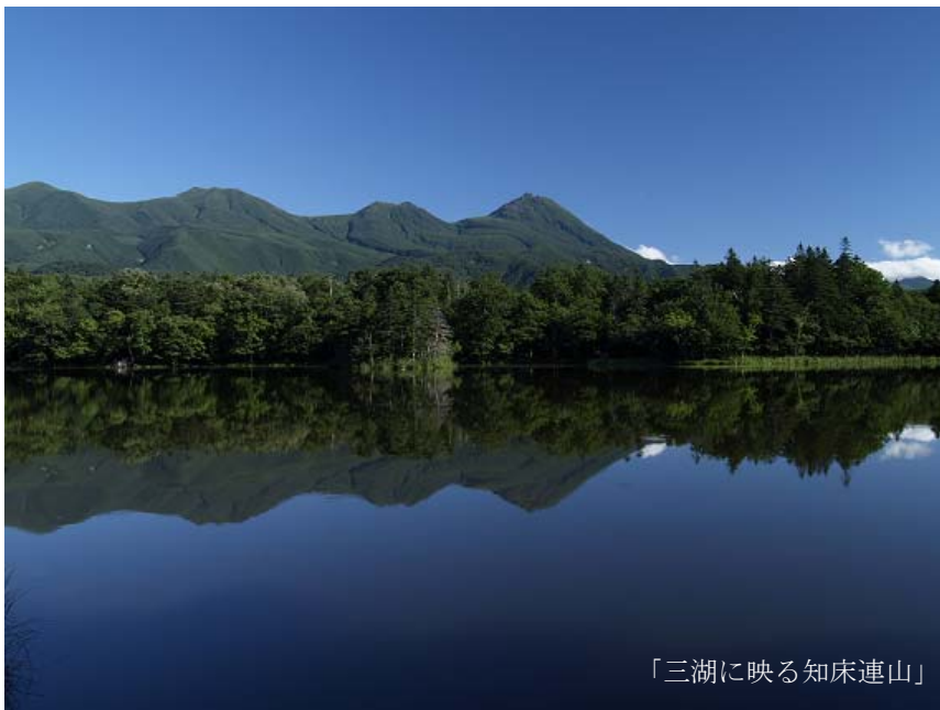
「三湖に映る知床連山」