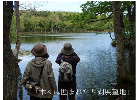
「木々に囲まれた四湖展望地」

原生林に囲まれた五つの湖をめぐる遊歩道を散策します。晴れた日の湖面には青い空と知床連山が映り、緑深い森の中で辺りに目を凝らせば、知床の森に暮らす様々な動物たちの営みを見つけることができます。知床の森の魅力をたっぷりと感じられる散策コースです。